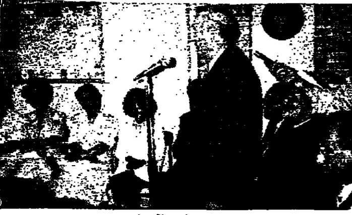
تعدّل علينا ان نحول دون قتل الانسان والحاق الضرر بالجمعة